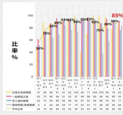
住宿式機構確診住民投藥比率